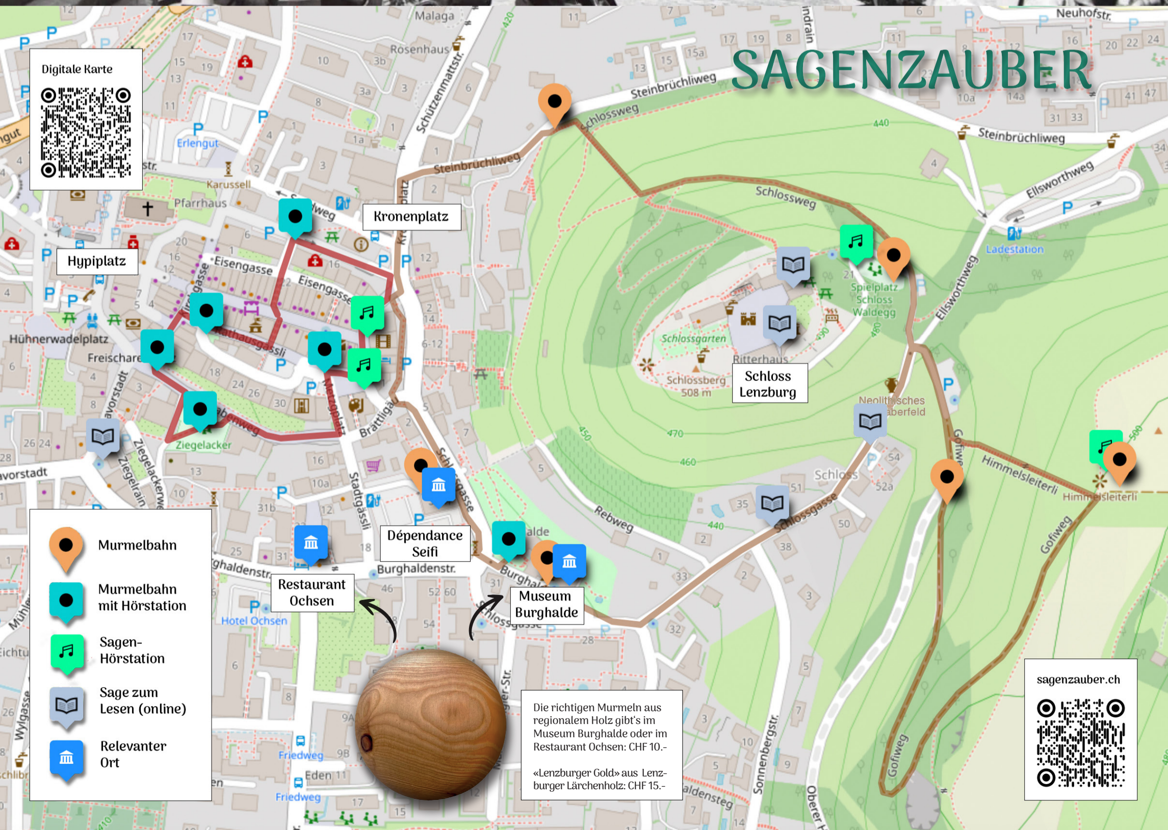
Jugendfest, Rathausgasse um 1910.